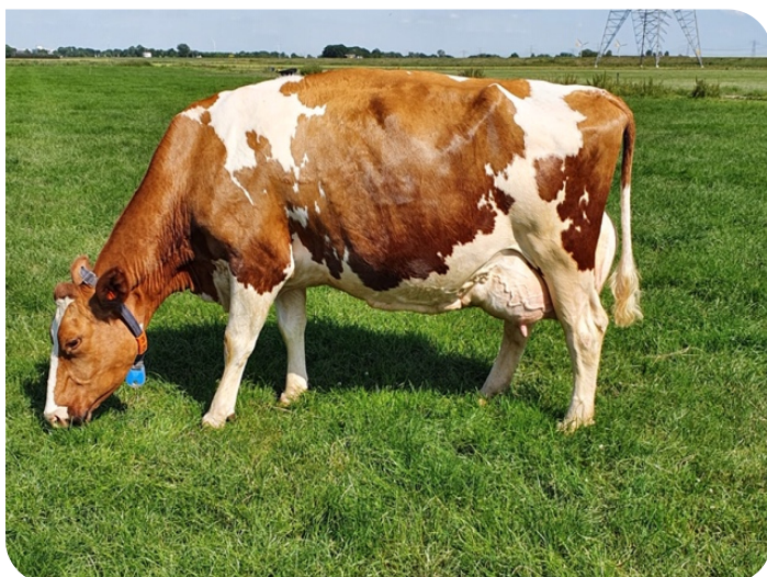
Mariahoeve Trees 142 (mère de Tribute Red)