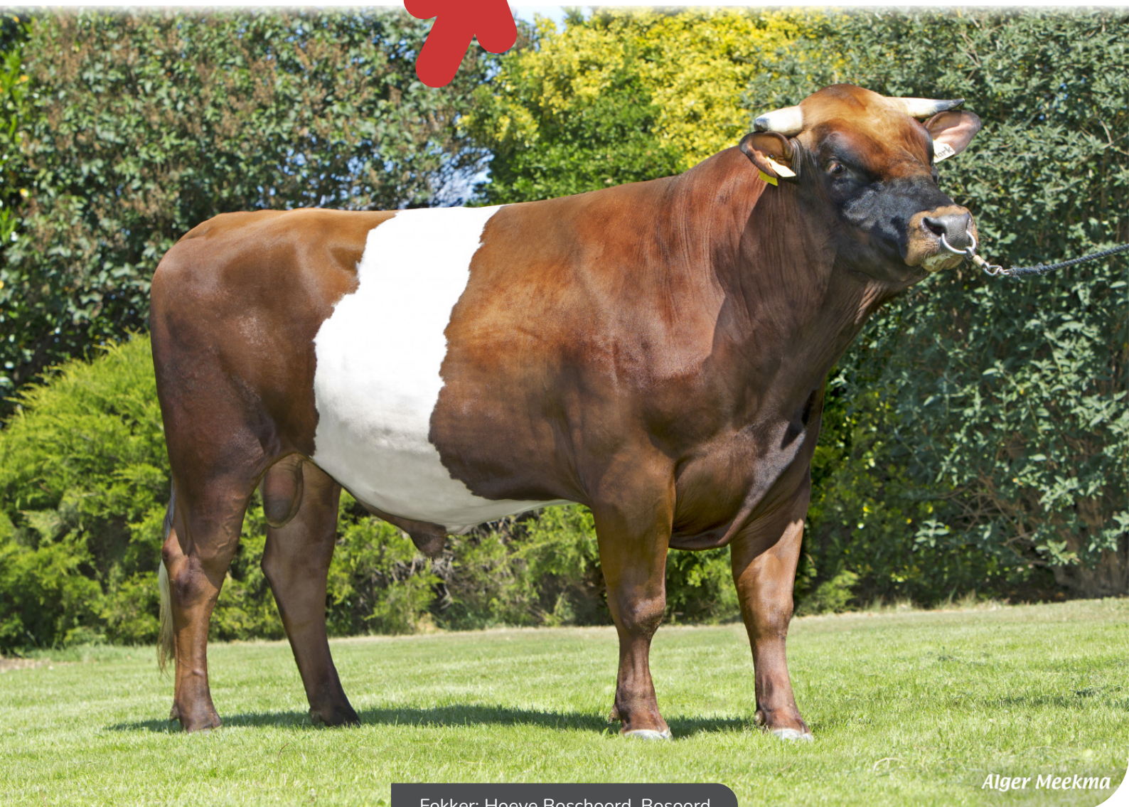
Fokker: Hoeve Boschoord, Bosoord