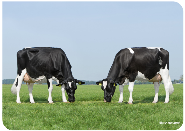
Koolstein Akke 183 et Koolstein Trijntje 493 (p. Fletcher) Prop.: VOF Kool, Appingedam (NL)