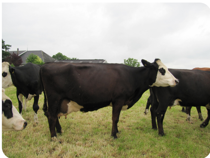
Mathilde 107 (mère de Matts)