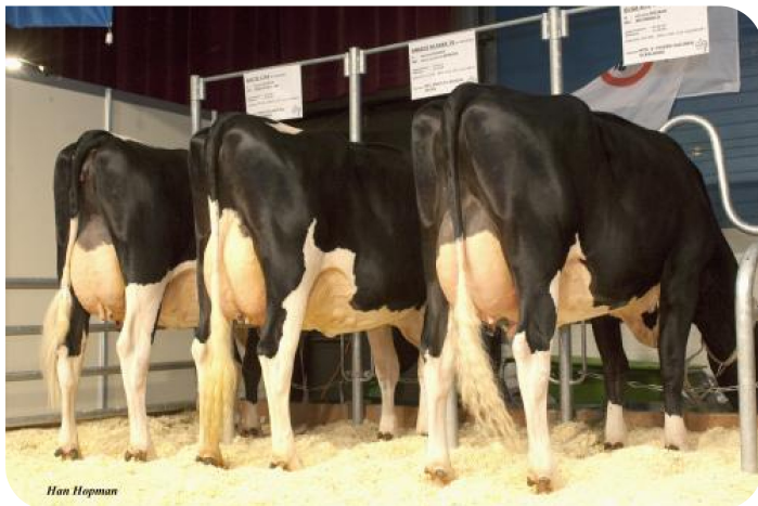
Filles de Kojack pie noir HHH Show 2009