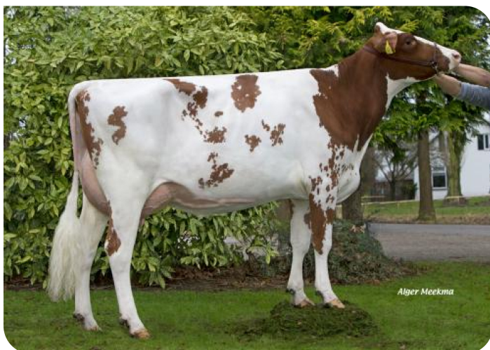
Rika 21 (p. Totilas)