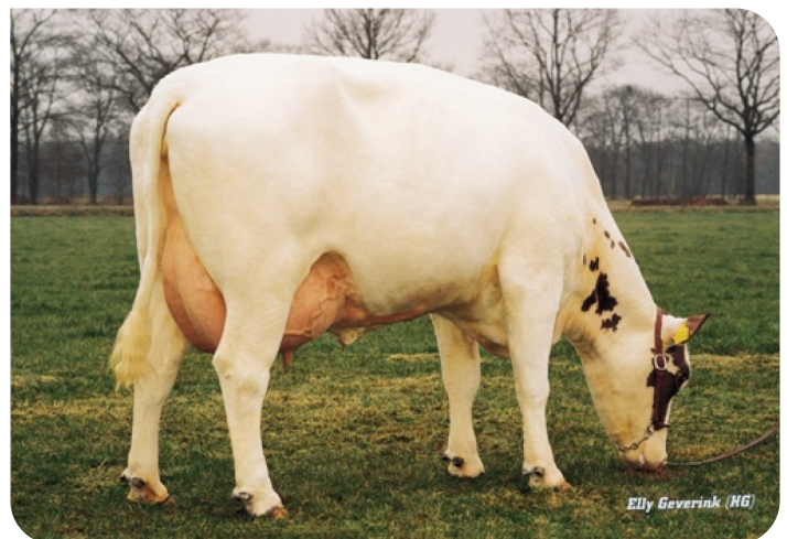
Elly Geverink (HG)