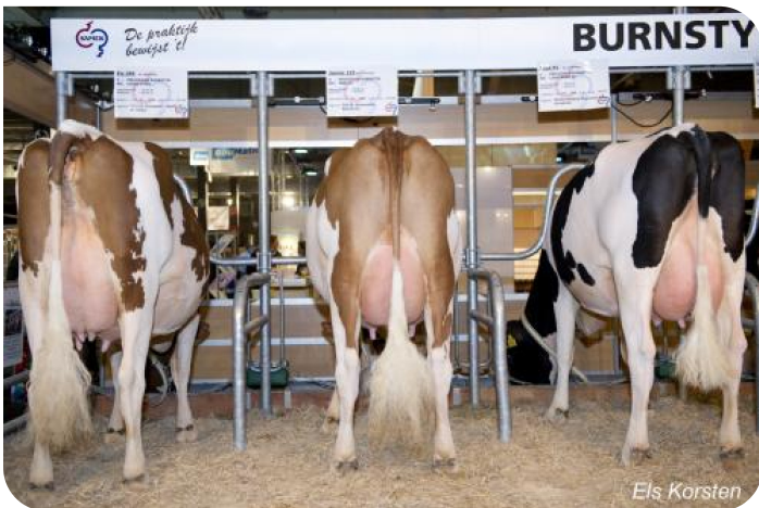
Lot de descendance de Burnstyn Gorinchem 2012