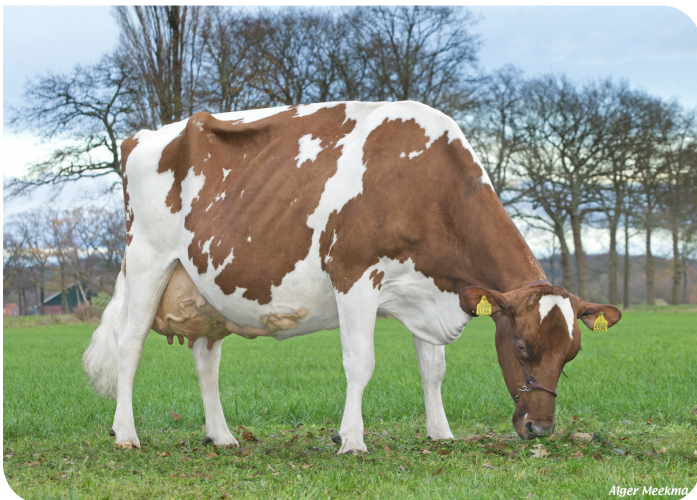
Els 286 (p. Burnstyn) Prop.: Mts. Arendsen Raedt, Barchem (NL)