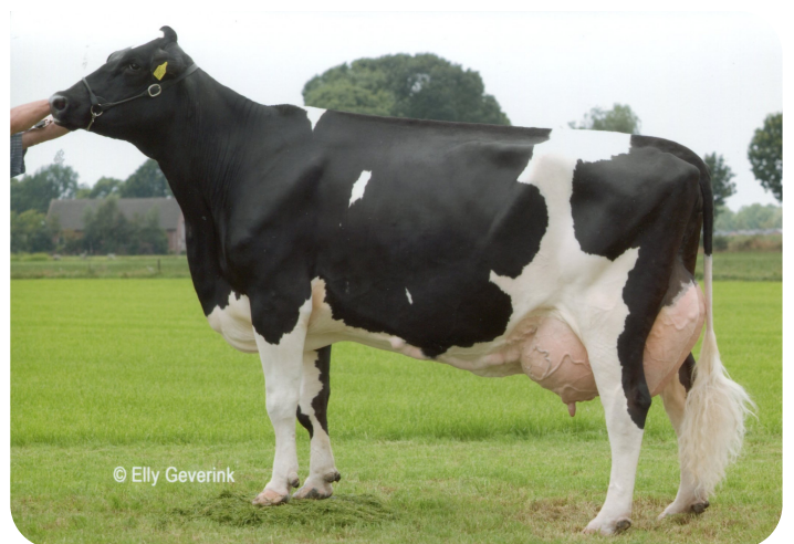
Peeldijker Liesje 385 (EX 90) (grand-mère de Burnstyn)