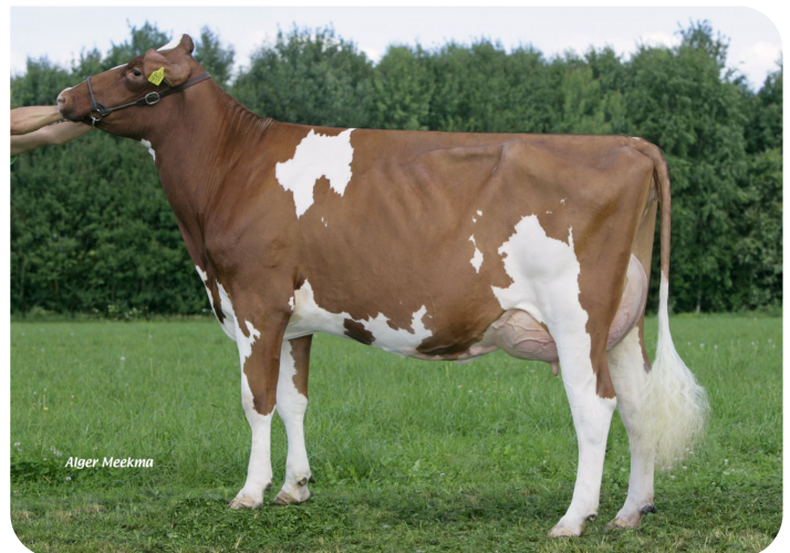
Bertha 98 (p. Burnstyn) Prop.: Melkveebedrijf Grashoek b.v., Grashoek (NL)