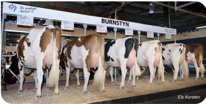
Lot de descendance de Burnstyn Gorinchem 2012