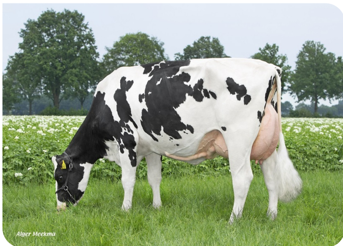
Peeldijker Liesje 1224 Grand-mère de Pennywise

2.04 462jrs 12745kg 5.12% 4.16% 3.10 325jrs 12947kg 5.14% 3.91% 4.10 338jrs 13301kg 5.20% 3.87% 5.10 376jrs 12022kg 5.55% 4.20% 7.01 354LL 14713kg 5.14% 3.92% 86 88 88 86 VG 87