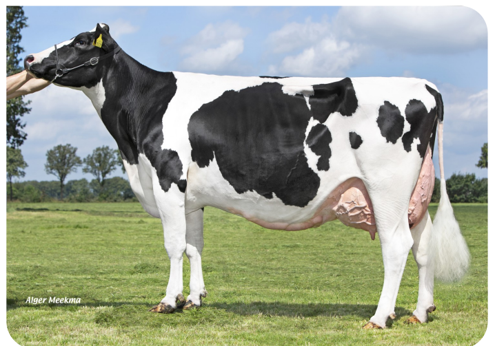
Peeldijker Liesje 1328 Mère de Pennywise