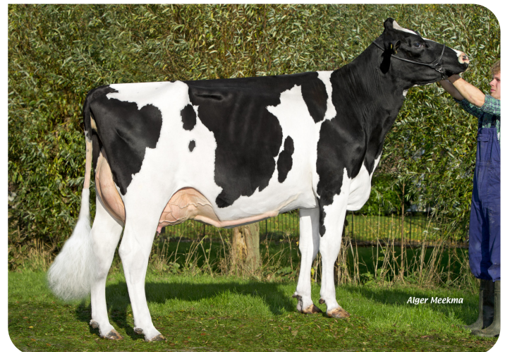
Plataan F7812 (VG 86) (mère de Florus)