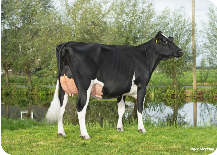
Nellie 258 (p. Florus)