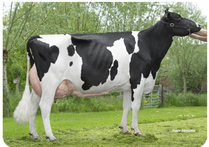
Plataan F7812 (VG 88) (mère de Florus)