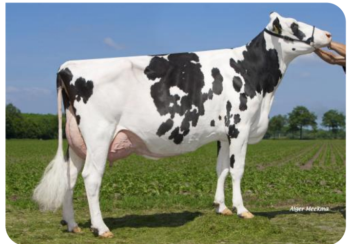
Grashoek Ruth 145 (VG 86) (p. Sunflower PS rf) (deuxième lactation) Prop.: Melkveebedrijf Grashoek b.v., Grashoek (NL)