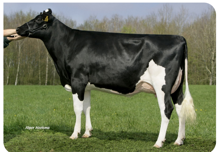
Grashoek Beaver 3 (VG 87) (p. Sunflower PS rf) Prop.: Melkveebedrijf Grashoek b.v., Grashoek (NL)