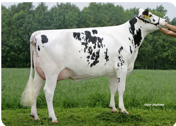
Fientje 785 (p. Sunflower PS rf) Prop.: Mts. Peeters, Kessel (NL)