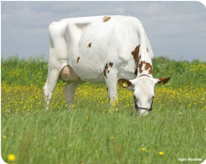
Esmeralda 181 (VG 86) (p. Sunflower PS rf) Prop.: Fa. J.P. & P.H. Köhne, Middenbeemster (NL)