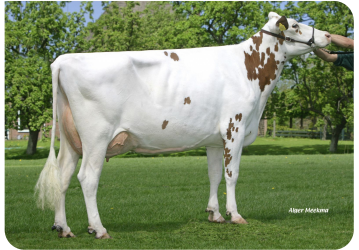
Esmeralda 181 (VG 86) (p. Sunflower PS rf) Prop.: Fa. J.P. & P.H. Köhne, Middenbeemster (NL)