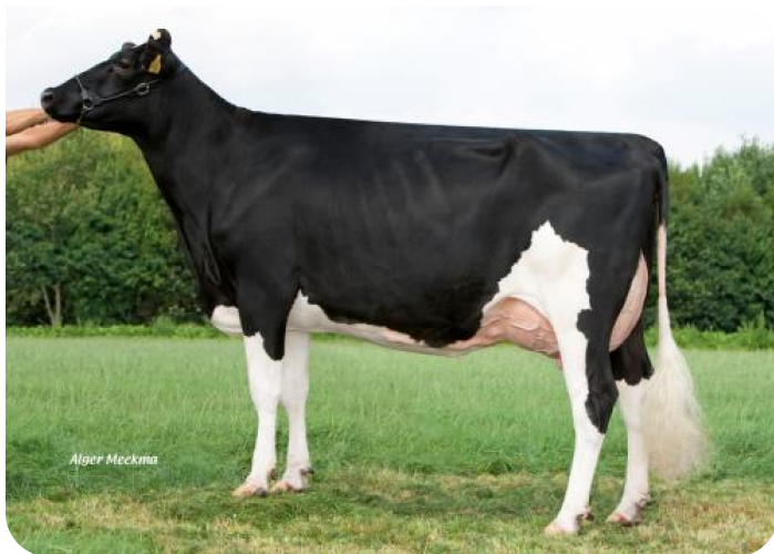
Grashoek Beaver 3 (EX 90) (p. Sunflower PS rf) Prop.: Melkveebedrijf Grashoek b.v., Grashoek (NL)