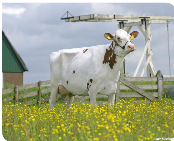
Esmeralda 181 (p. Sunflower PS rf) Prop.: Fa. J.P. & P.H. Köhne, Middenbeemster (NL)