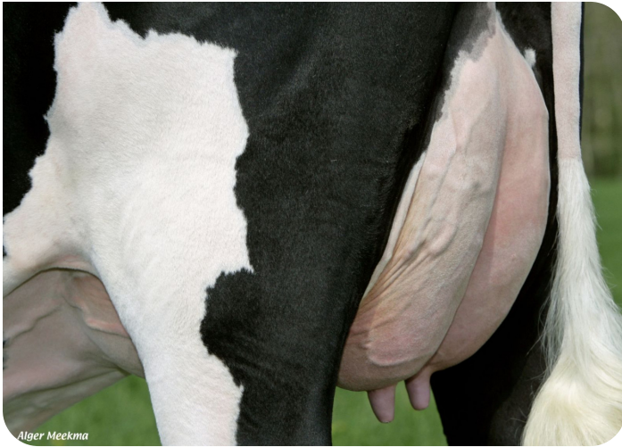
Mamelle de Grashoek Beaver 3 (p. Sunflower PS rf) Prop.: Melkveebedrijf Grashoek b.v., Grashoek (NL)