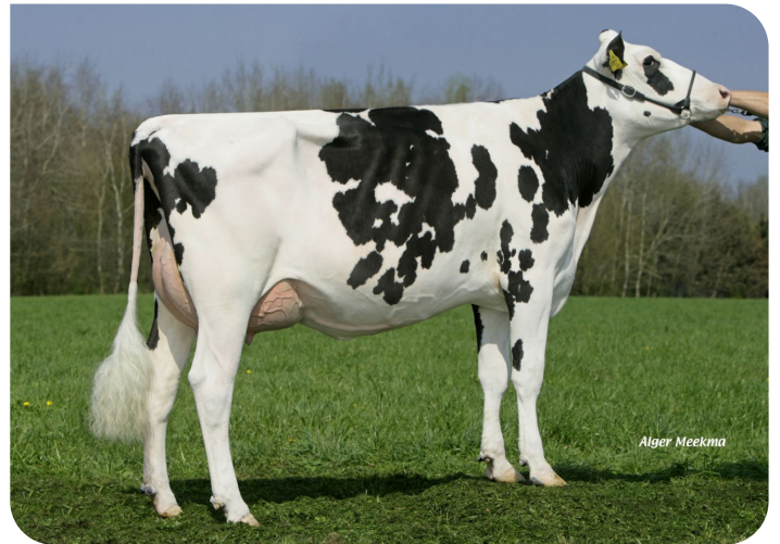
Grashoek Ruth 145 (VG 86) (p. Sunflower PS rf) rop.: Melkveebedrijf Grashoek b.v., Grashoek (NL)