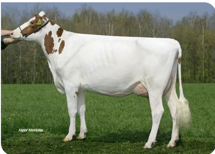
Grashoek Frieska 179 (VG 85) (p. Sunflower PS rf) Prop.: Melkveebedrijf Grashoek b.v., Grashoek (NL)