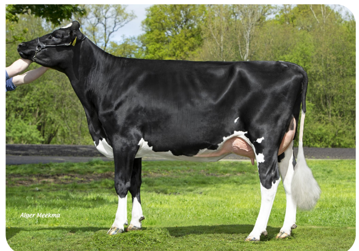
Diekers 3Star Ka Ida 3 (p. Kayne)