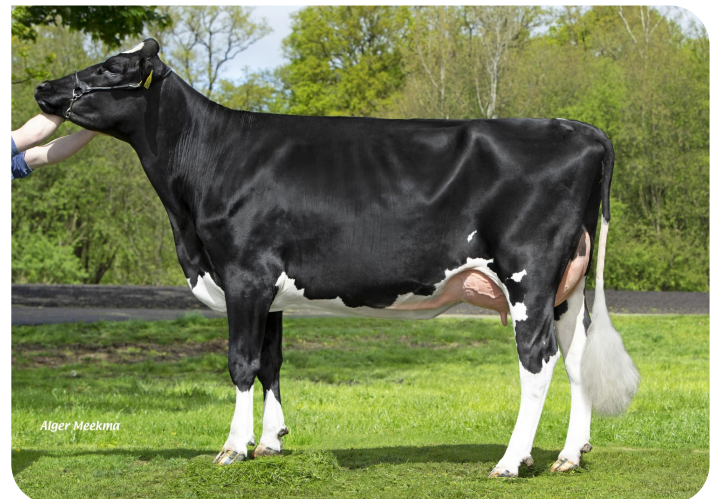
Diekers 3Star Ka Ida 3 (p. Kayne)

Prop.: Maatschap B. en G. Eiting, Rekken, (NL)