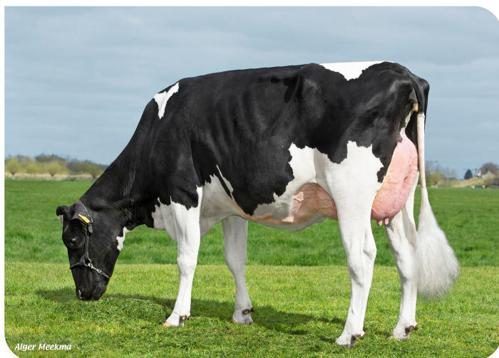
Poppe Red Hot Feather(VG 87) Mère de Freebird Red