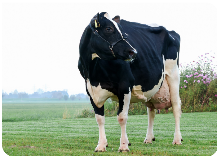
Lis K&L Xemmi Mère de Surano