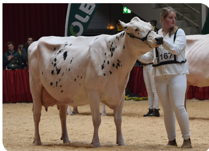
Irose 42 Mère de Primrose