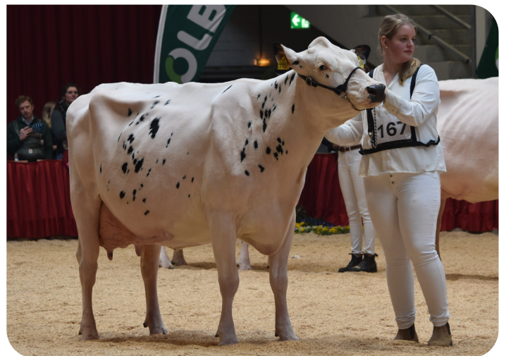
Irose 42 Mère de Primrose