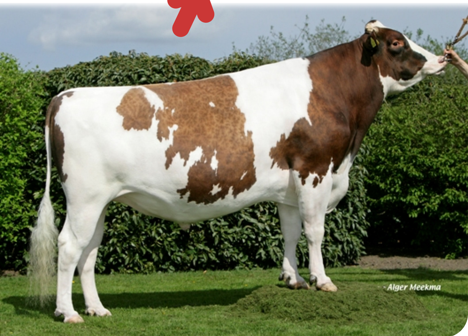
- Alger Meekma