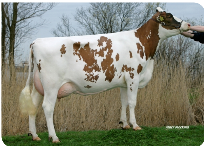
Cornelia 2007 (p. Red Mystery)