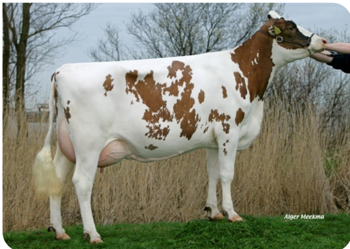
Cornelia 2007 (p. Red Mystery)