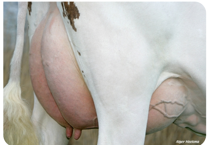
Mamelle de Cornelia 2007 (p. Red Mystery)