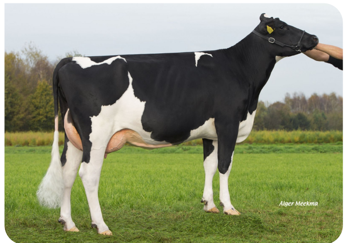
Grashoek Nel 138 (p. Arkansas) Prop.: Melkveebedrijf Grashoek b.v., Grashoek (NL)