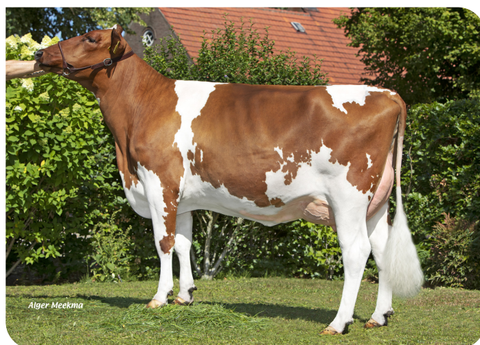
Pieta 170 (p. Musthave Red) Prop.: Melkveebedrijf van Delft VOF, Elshout (NL)