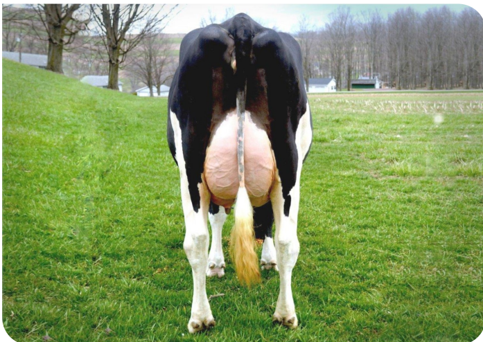
Scenic-Vista Ardels Raya-ET-P Pleine sœur de Radix-P rf Prop.: Scenic-Vista Farms, Western Maryland, USA