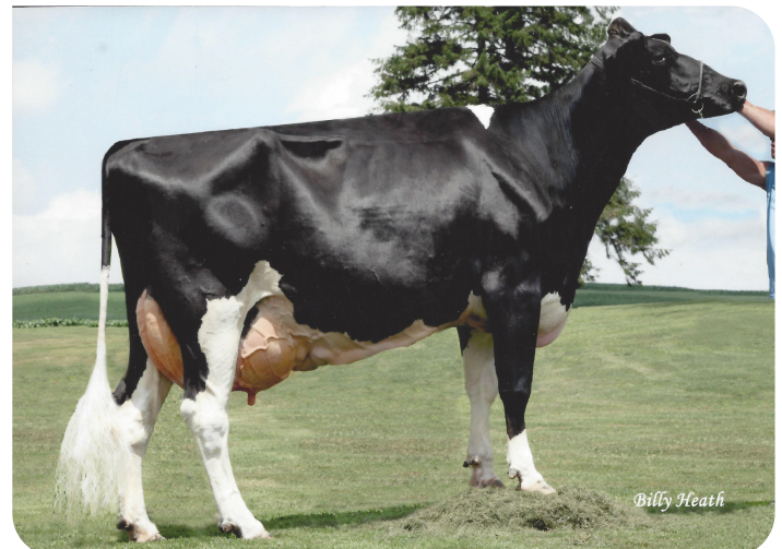
Elk-Lick Durhm Ardel Lea-ET (EX92) (grand-mère de Radix-P rf)