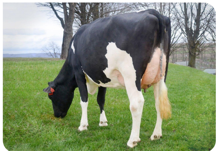
Scenic-Vista Ardels Raya-ET-P Pleine sœur de Radix-P rf Prop.: Scenic-Vista Farms, Western Maryland, USA