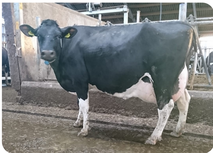
Hennie 63 Mère de Skymaster