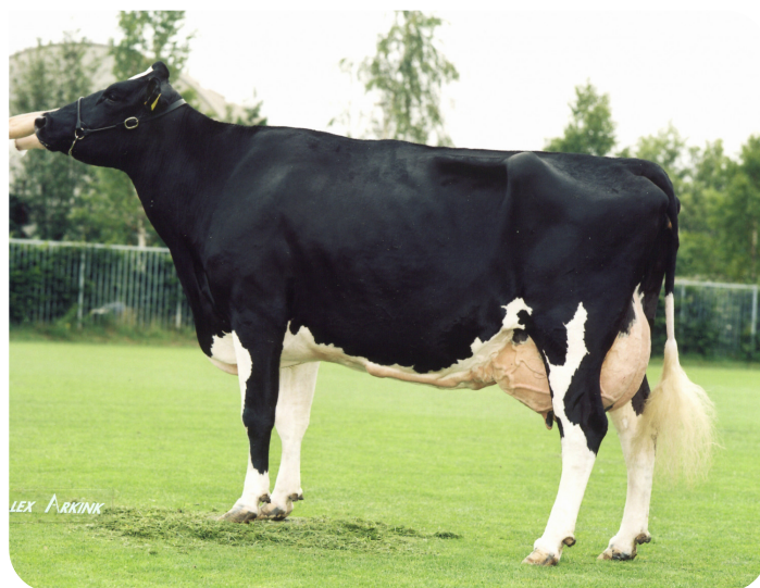
Geertje 289 (EX 94) (mère de Profile)