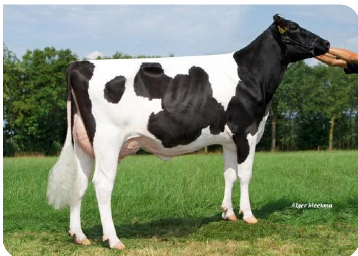
Grashoek Vrije Tulp 30 (p. Profile)

Prop.: Melkveebedrijf Grashoek b.v., Grashoek (NL)