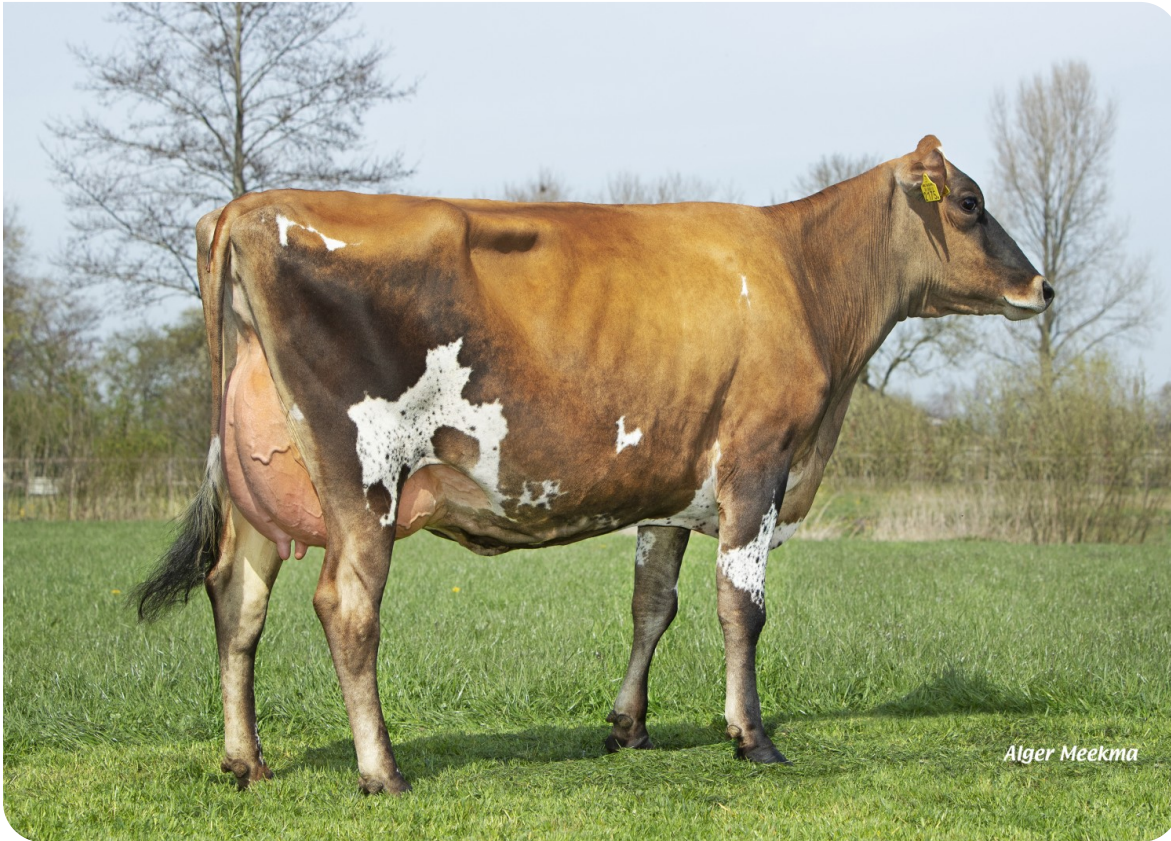
Bossink Dies 57 (p. Sullivan, 50% Jer./50% RHF) Prop.: Van der Kolk Melkvee V.O.F., Wierden (NL)