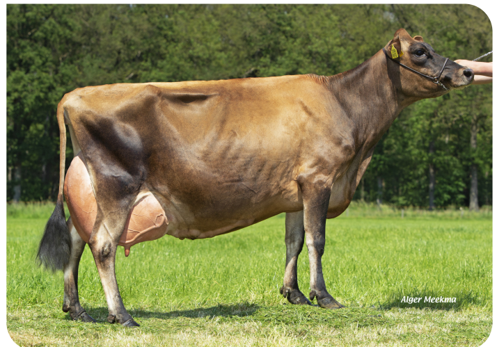
Missy 9490 (pleine soeur de Sullivan) (4ème lactation)