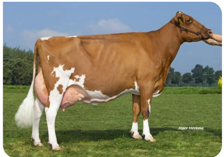
Grashoek Roza 98 (p. Moonshine) (troisième lactation) Prop.: Melkveebedrijf Grashoek b.v., Grashoek (NL)