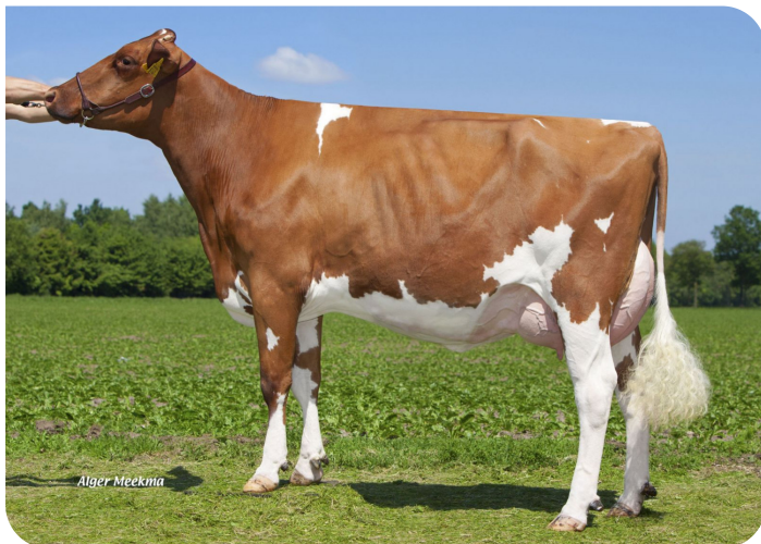
Grashoek Roza 98 (p. Moonshine) Prop.: Melkveebedrijf Grashoek b.v., Grashoek (NL)