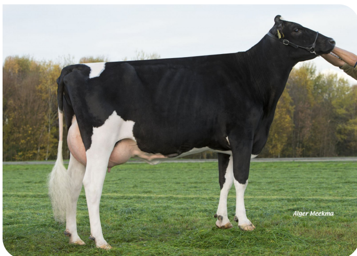
Grashoek Marjan 11 (p. Moonshine)

Prop.: Melkveebedrijf Grashoek b.v., Grashoek (NL)