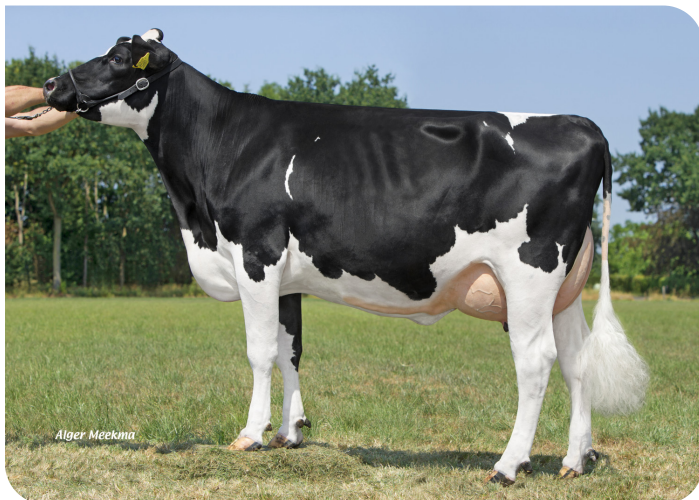
Grashoek Sneeker 308 (p. Mexx) Prop.: Melkveebedrijf Grashoek b.v., Grashoek (NL)