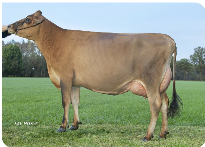
Grashoek Roza 178 (p. Napoleon PP) Prop.: Fok- en melkveebedrijf K.I. Samen B.V., Grashoek (NL)