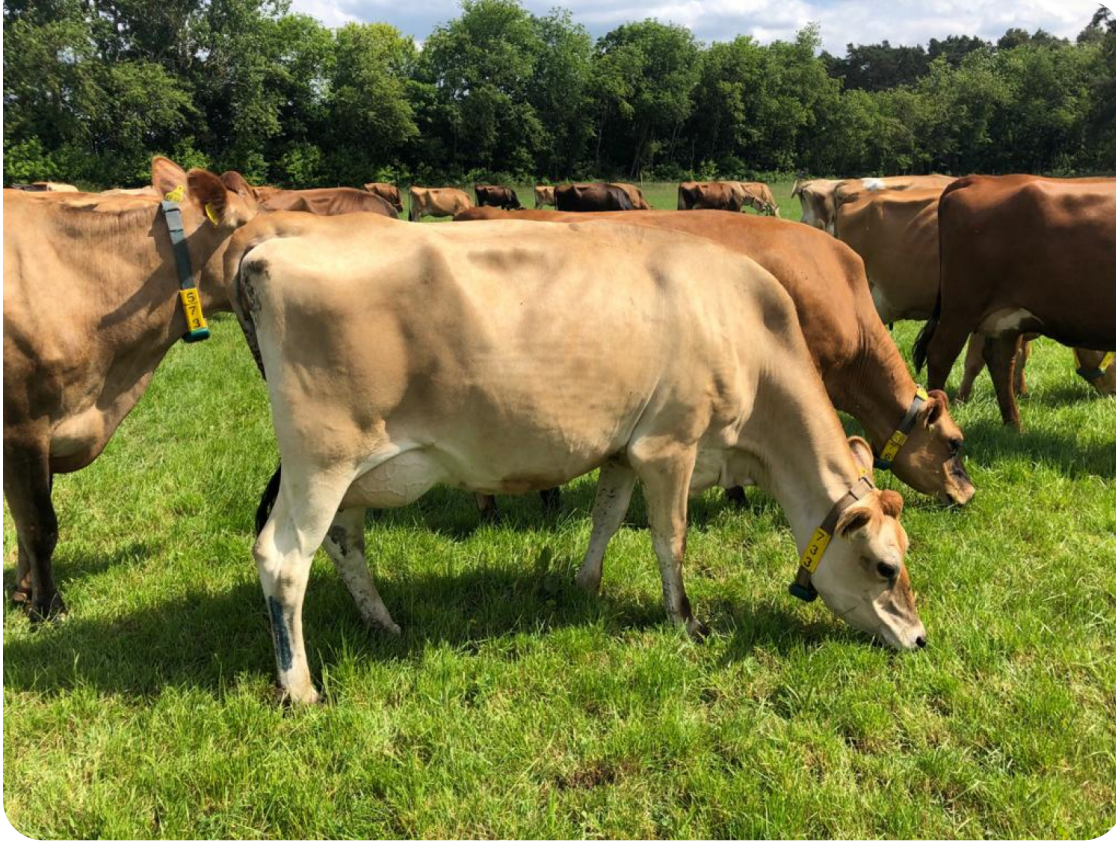
Cette fille de Napoleon (PP)