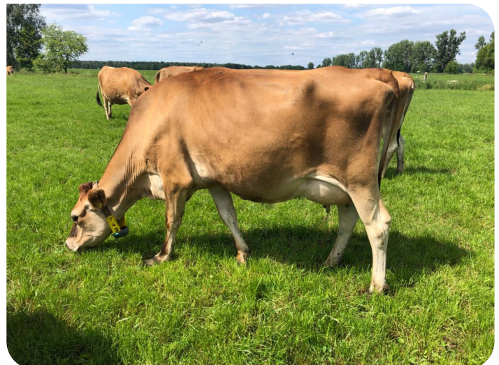
Cette fille de Napoleon (PP) Prop.: Ags. Bar. Urstromtal mbH & CoKG