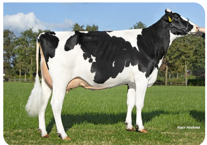
Marianne 361 (p. Tobor) Prop.: Te Voortwis C.V., Winterswijk-Miste (NL)