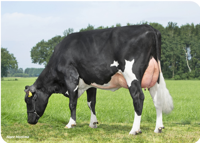
Grashoek Janna 156 (VG 85) (p. Tobor) Prop.: Melkveebedrijf Grashoek b.v., Grashoek (NL)