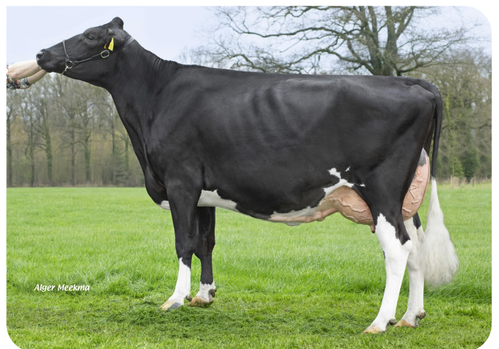
VDR Sandra 7 (VG 86) Mère de Simple Mind