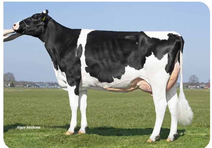
Leida 769 (p. Slash) Prop.: V.O.F. Miskotte, Den Ham (NL)