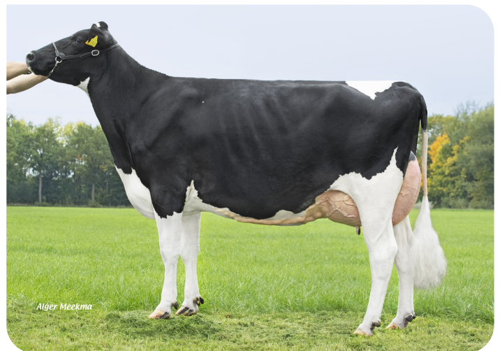
Grashoek Vrije Tulp 81 (VG 87) (v. Slash) Prop.: Fok- en melkveebedrijf K.I. SAMEN, Grashoek