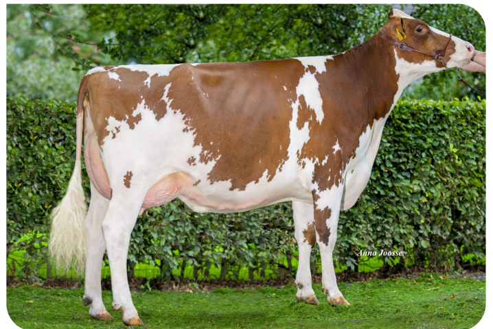
Visstein 3STAR Adiva Red (VG 87) Mère de Iconic Red P