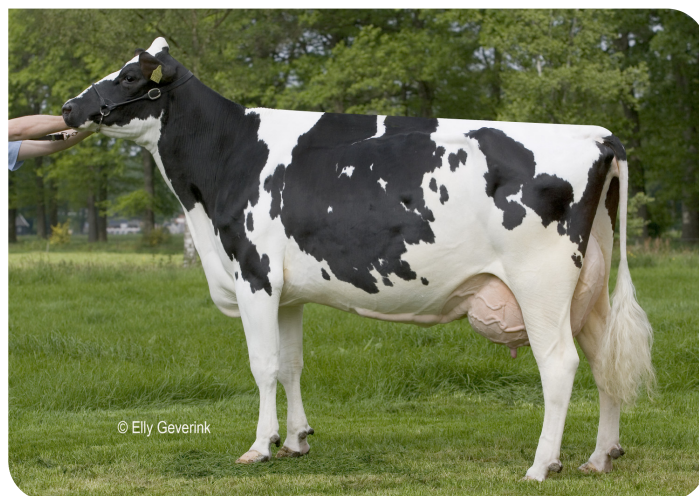
Denta 26 (EX 90) (mère de Watson rf)