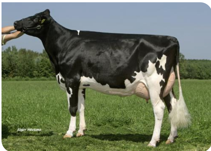
Tina 3 (p. Erwin WH) Prop.: Mts. G. & G. & A. v. Hoven-Huijnen, Eckelrade (NL)