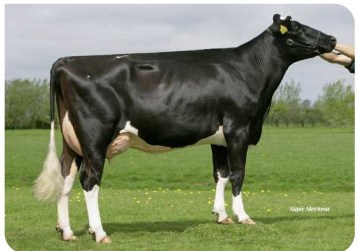
Carla 339 (p. Erwin WH) Prop.: Firma J.C. Wester, Opmeer (NL)