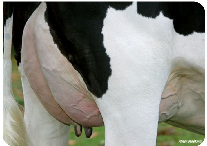
Mamelle (VG 88) de Veronie 585 (p. Viking WH) Prop.: Mts. Poppe, Zwolle