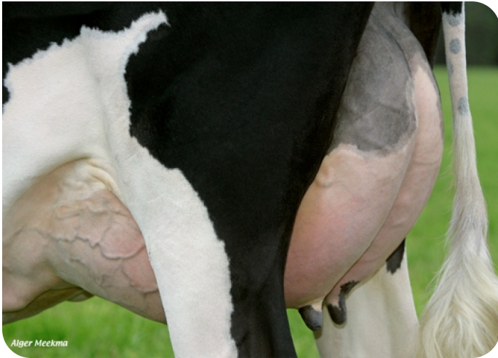
Mamelle de Nana 4 (p. Viking WH) Prop.: Mts. Schrijnwerkers, Beringe (NL)