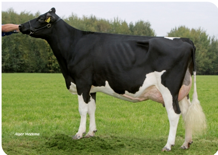
Nana 4 (p. Viking WH) Prop.: Mts. Schrijnwerkers, Beringe (NL)