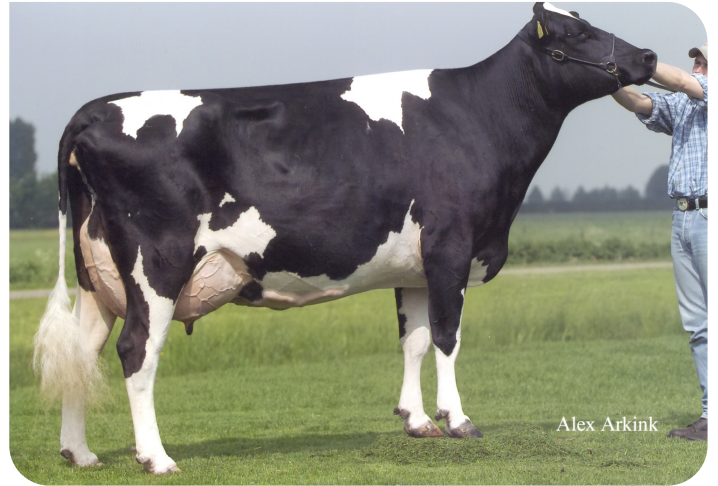
Willemshoeve Rita 233 A (EX 92) (mère de Viking WH)