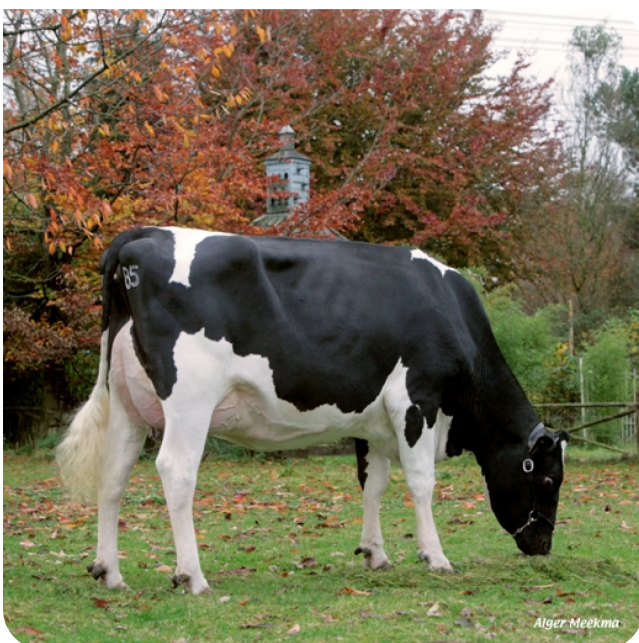
Veronie 585 (VG 86) (p. Viking WH) Prop.: Mts. Poppe, Zwolle