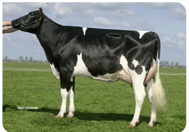
Cuperius 208 (p. Viking WH) Prop.: Monsieur T. de Jonge, Westbeemster (NL)