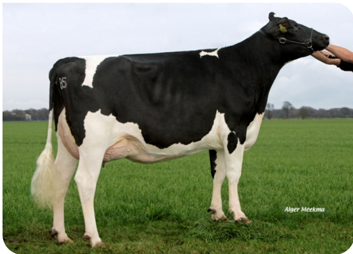
Veronie 585 (VG 86)(p. Viking WH) Prop.: Mts. Poppe, Zwolle