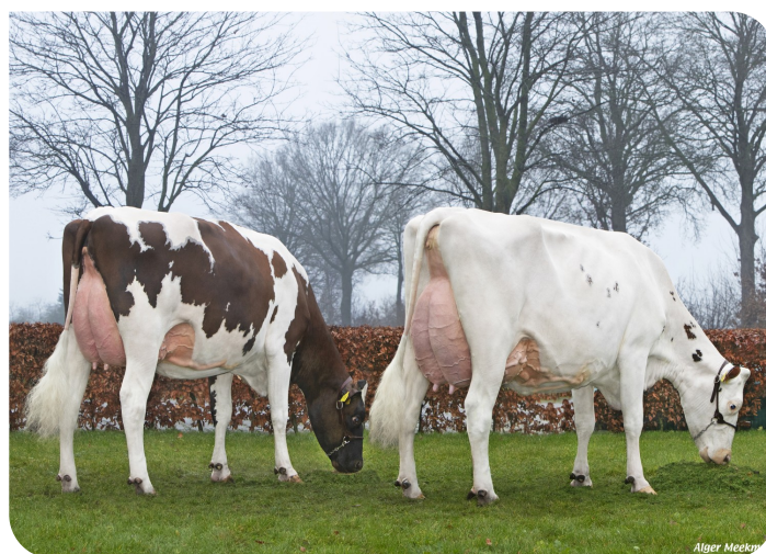
Wilskracht Warsi 1112 (Mère de Allianz P)