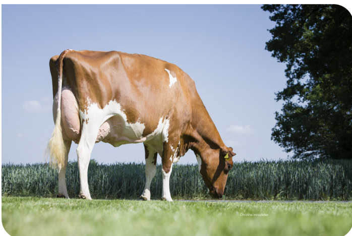
WR Monroe (EX 90) Grand-mère de Centrum