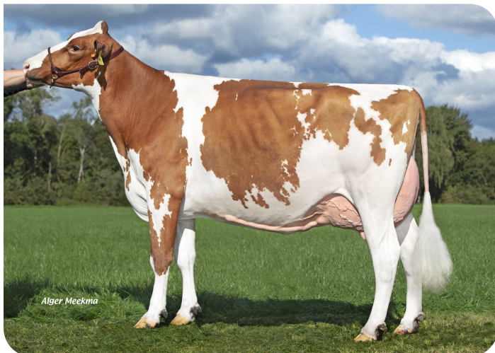
Grashoek Julia 123 (p. Centrum) Prop.: Fok- en melkveebedrijf K.I. Samen B.V., Grashoek (NL)