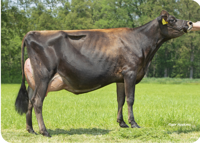
Annejet 9578 (p. Trenton Pp) Prop.: Mts. ter Mors, Haakbergen (NL)