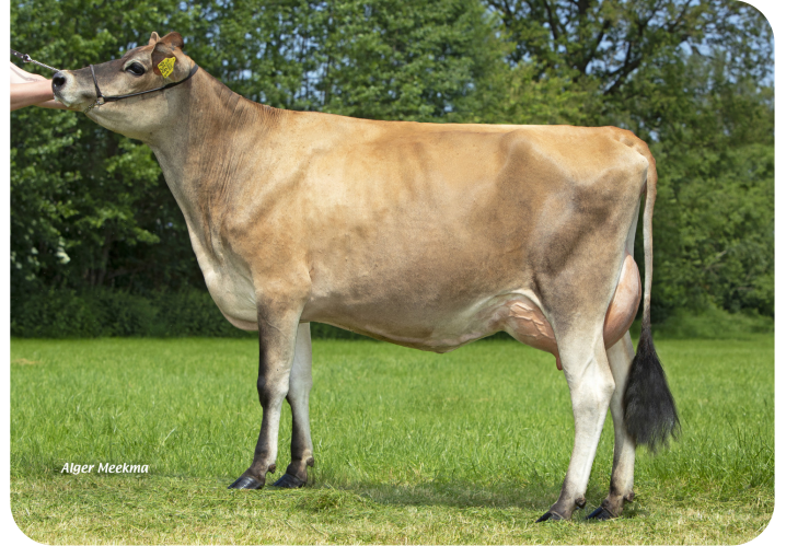
Missy 9581 (p. Trenton Pp) Prop.: Mts. ter Mors, Haakbergen (NL)