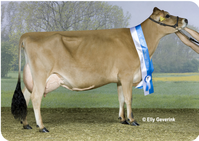
WS Katanga Gannon (mère de Trenton (Pp))